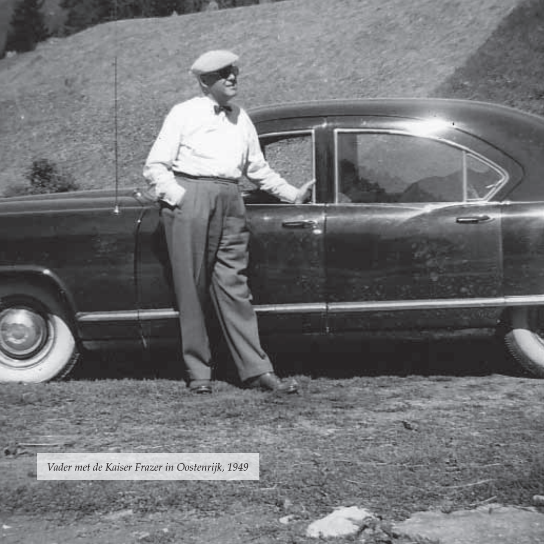
Vader met de Kaiser Frazer in Oostenrijk, 1949