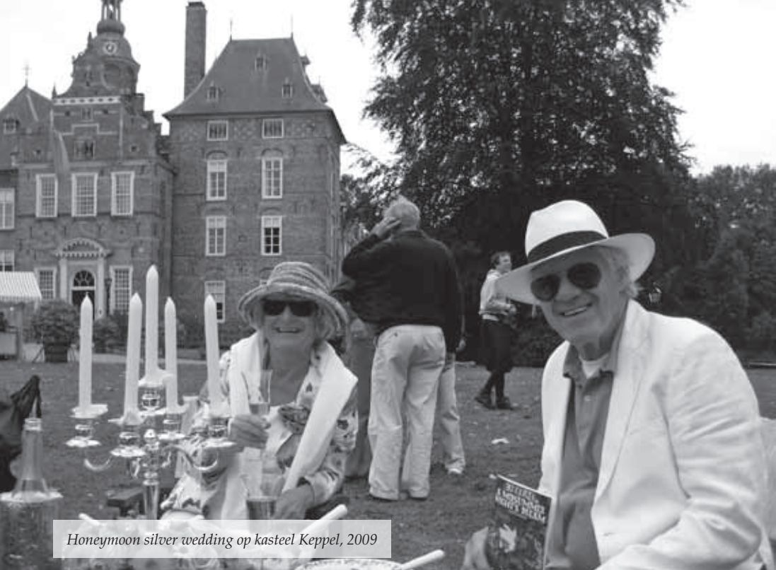
Honeymoon silver wedding op kasteel Keppel, 2009

discrete afstand onmisbaar gemaakt, dat ik de weddenschap met haar dat ik voorlopig niet zou trouwen, aan haar verloren heb. Veel vrouwen hebben het waanzinnige vermogen om hun eigen voorkeuren ondergeschikt te maken aan die van hun man. Misschien