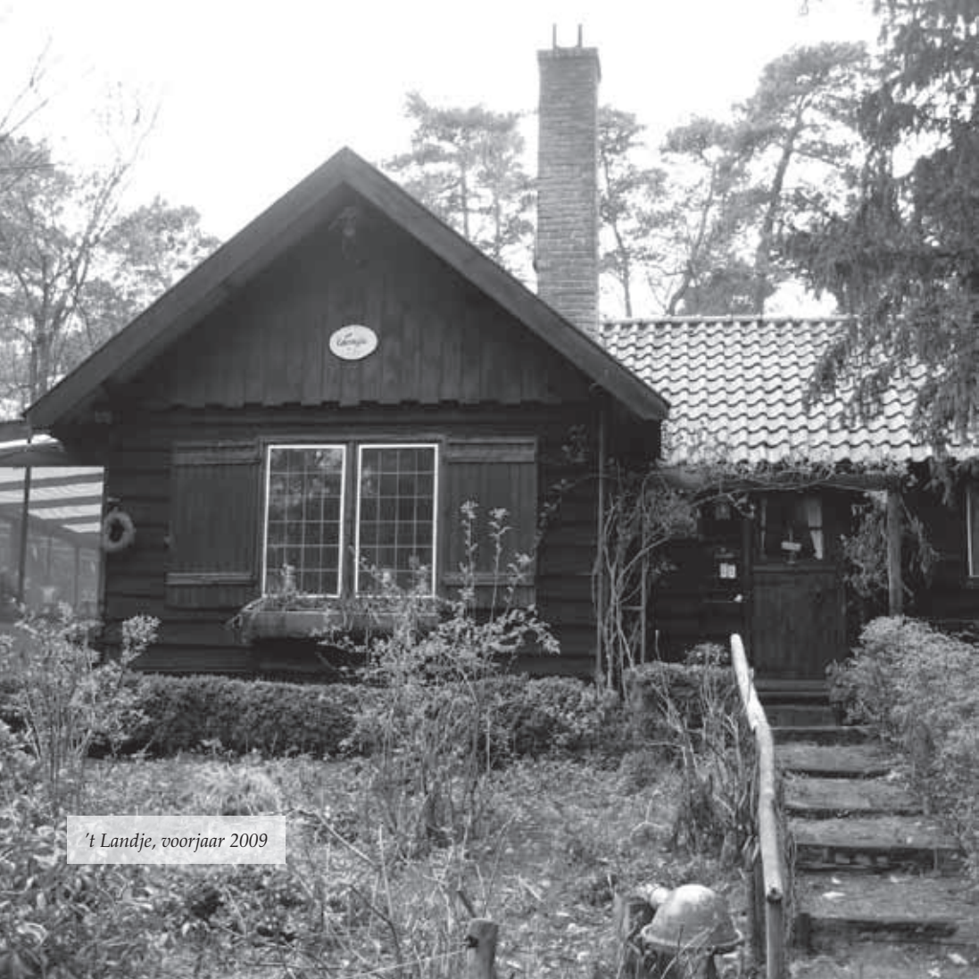
't Landje, voorjaar 2009