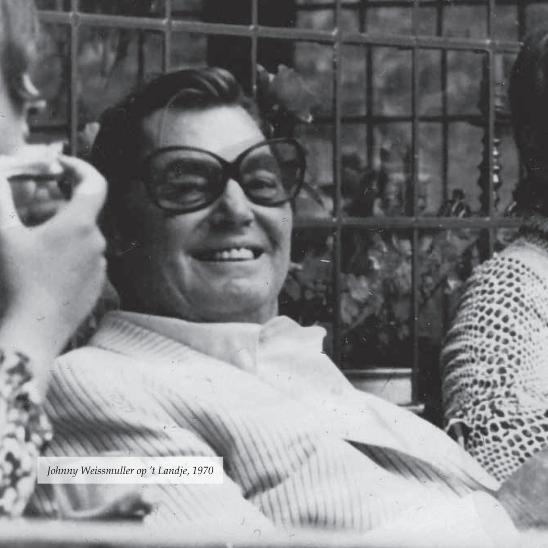
Johnny Weissmuller op 't Landje, 1970