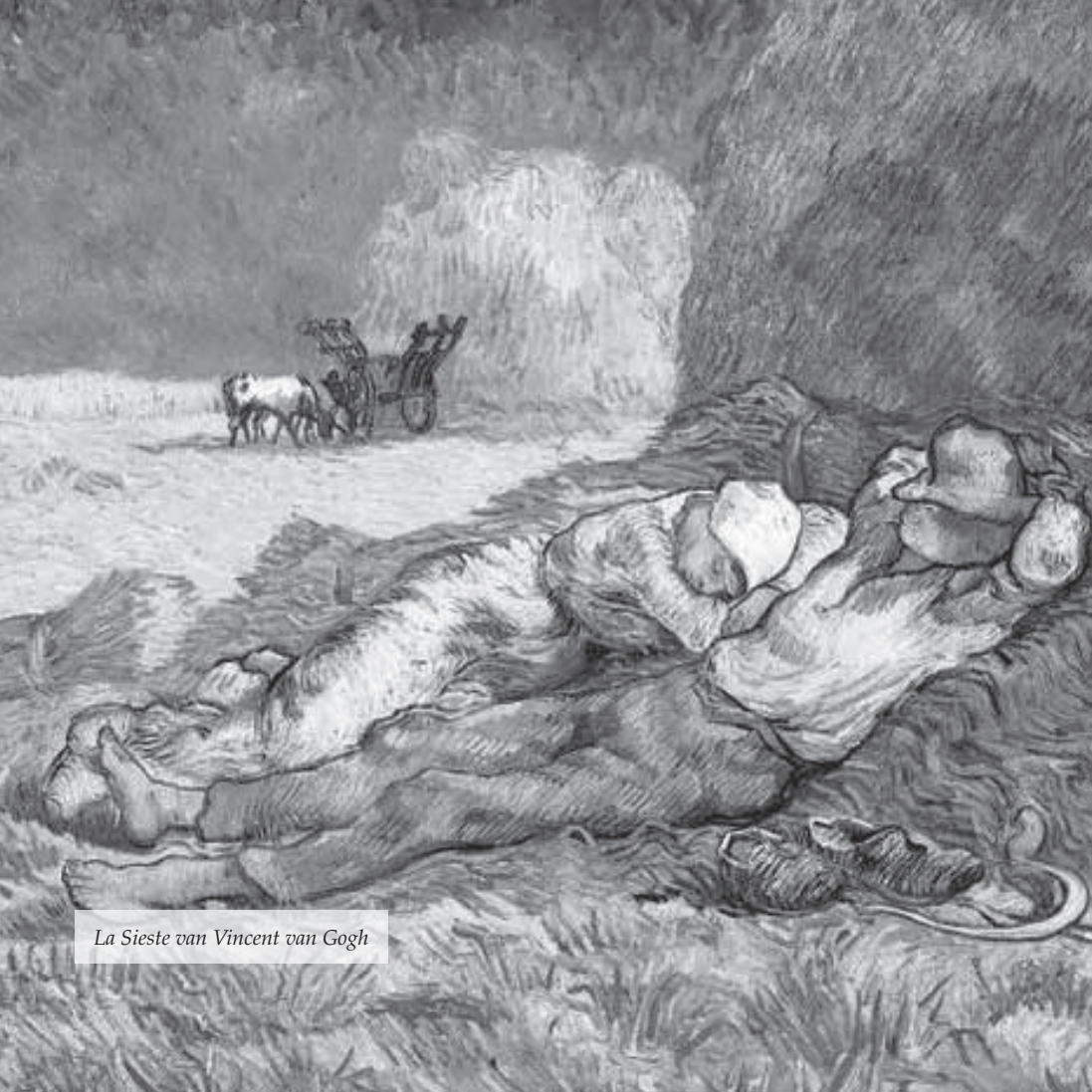
La Sieste van Vincent van Gogh