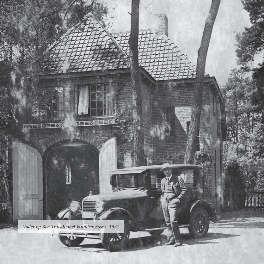
Vader op Ben Trovato met Humber Essex, 1931