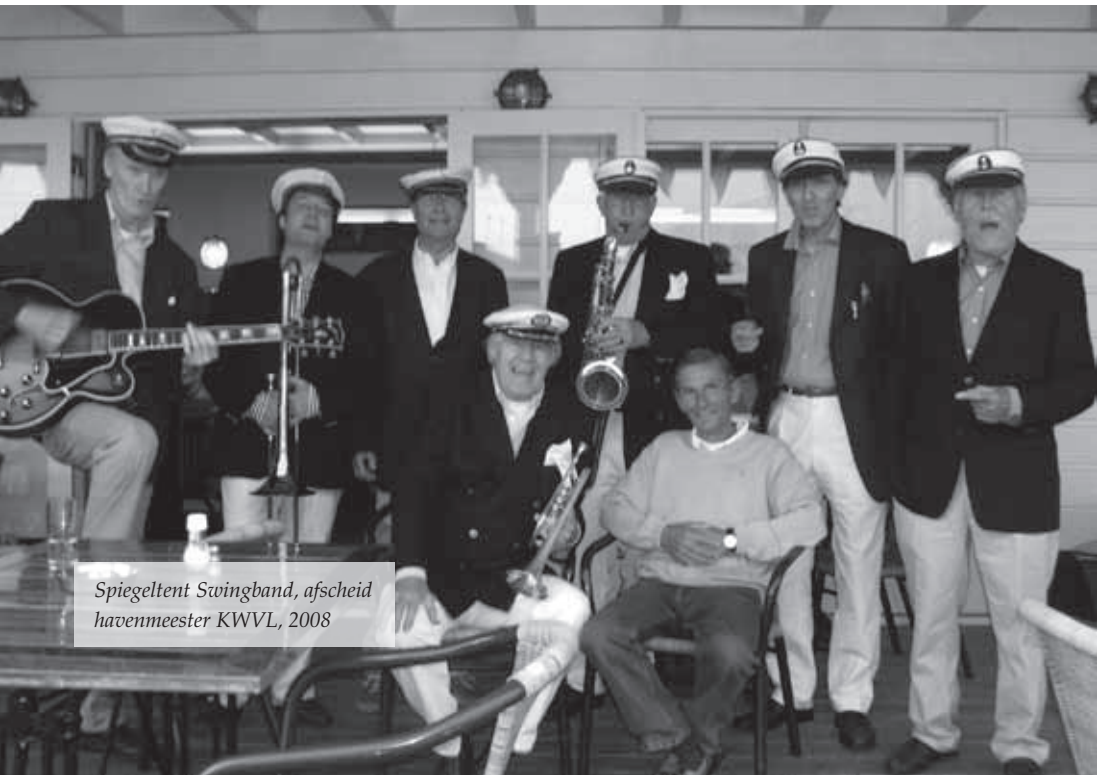
Spiegeltent Swingband, afscheid havenmeester KWVL, 2008

studentencorpora, middelbare scholen en hockeyclubs in het land, maar heft zichzelf op nadat studies zijn beëindigd en andere zaken in het leven belangrijker worden. Ik speel in verschillende kleinere bezettingen tot 1978, wanneer in Bilthoven in Wim van Miltenburgs