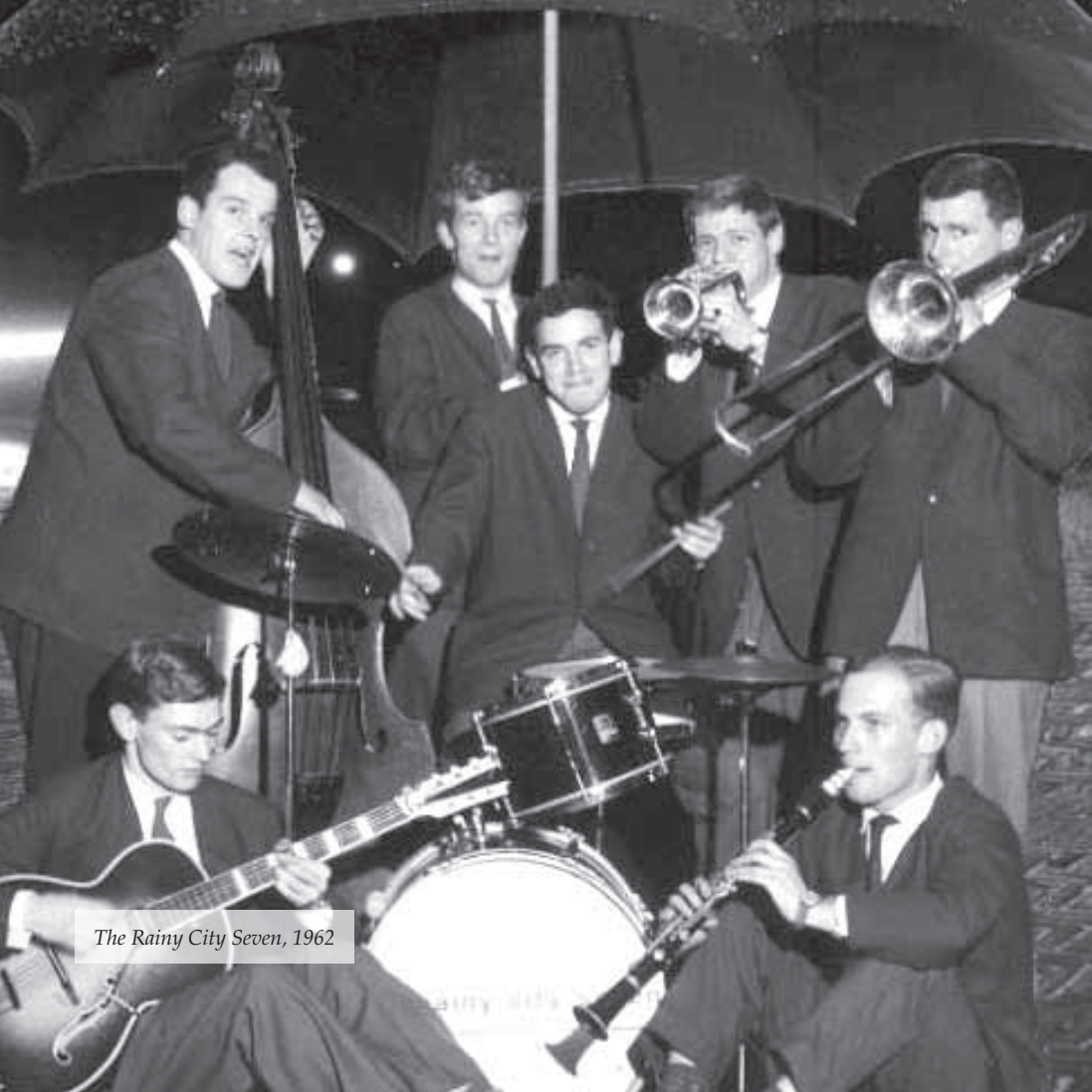
The Rainy City Seven, 1962