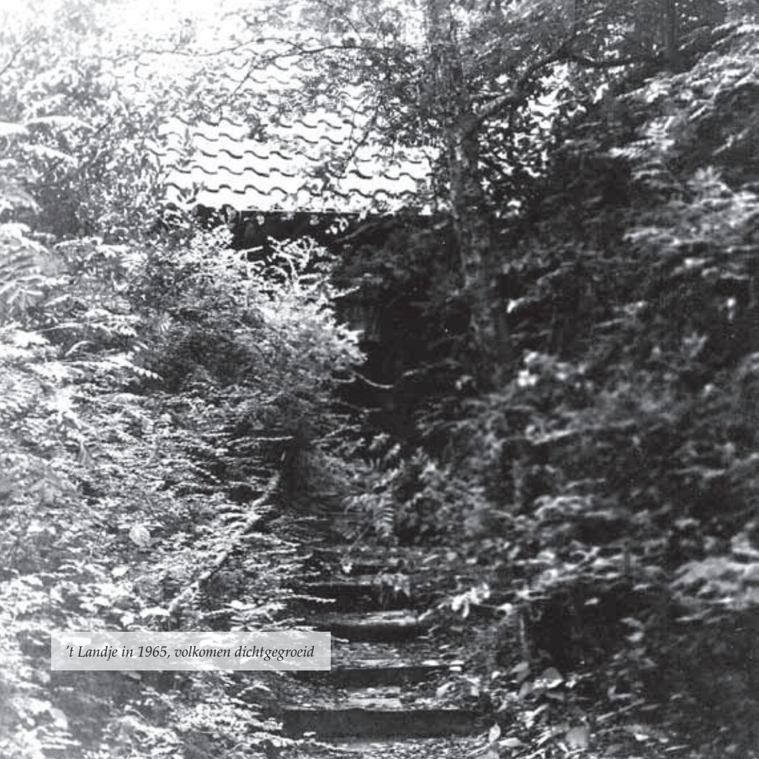
't Landje in 1965, volkomen dichtgegroeid