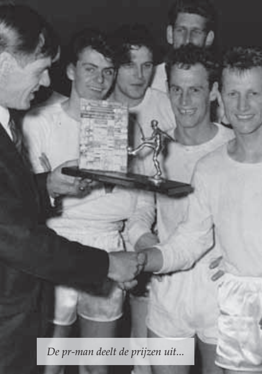
De pr-man deelt de prijzen uit...