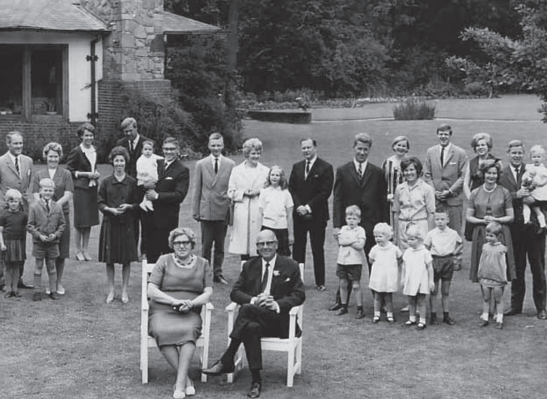
Vaders zeventigste verjaardag op Blankeweer in Bilthoven, 1965